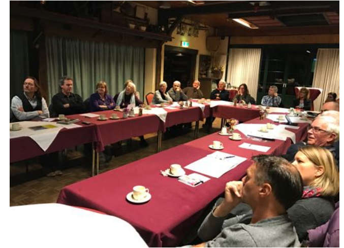
MATRIX WENSEN EN EISEN HERINRICHTING HESSENWEG DORPSKERN ACHTERVELD PER THEMA