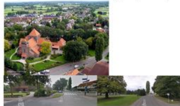
06-10-2016 De werkdag Achterveld Samenleving.nl 25